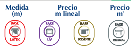
Tabla de descuentos Rotulación Digital